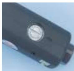
Ενσωματωμένος διακόπτης ρύθμισης αριθμού στροφών