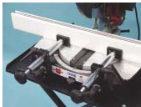
Σφιγκτήρας σταθεροποίησης Κωδ. Αρ. 0702 300 001